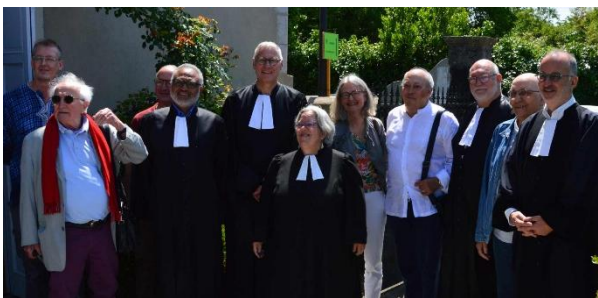
Les 11 pasteurs présents