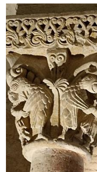
2 des chapiteaux de la crypte St Girons